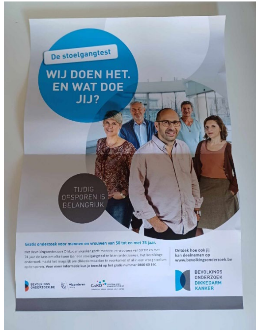
Affiche 2 (verloop)